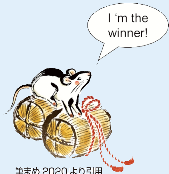
筆まめ 2020 より引用

今年は、子年で十二支の最初の年です。逸話によると、元日の朝1番早く神様のもとに来たのがネズミであったので、十二支の最初がネズミになったと云うことですが、ネズミが一番になるために、ネコを騙し、ウシの背中にこっそりと乗って最後に飛び降りてゴールしたということです。道徳教育上は、あまり褒められた行為ではないように思いますが、当時の神様はそれを評価したということになります。「どんな手段を使っても良いから一番にさえなればよい。」との教えでしょうか。さすが、神様には先見の明があると感心します。ネズミはきっと21世紀の新自由主義の象徴なのでしょう。